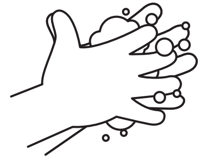
Frotate las manos durante 20 segundos